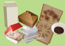
Recipientes de papel para llevar y otros papeles sucios con alimentos.