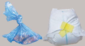
Desechos de mascotas, pañales y productos femeninos