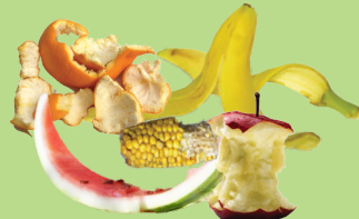
Restos de frutas y verduras