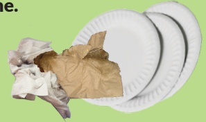
Vasos, platos, pañuelos y servilletas de papel sucios.