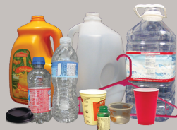
Envases de plástico y otros artículos de plástico rígido.