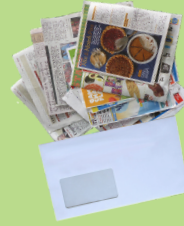
Periódico, correo basura y revistas.