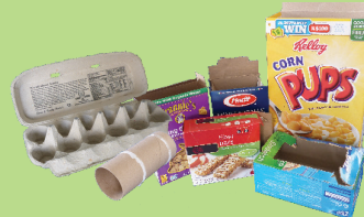
Cajas de papel, cartones de huevos y tubos de papel.