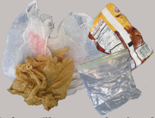
Bolsas, film y envoltorios de plástico