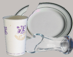
Cerámica y vajilla