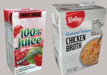
Cajas de cartón estables