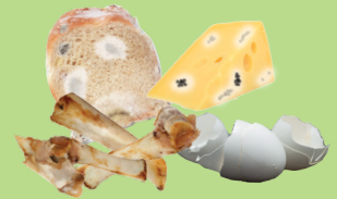
Alimentos en mal estado, productos lácteos, cáscaras de huevo y restos de carne.