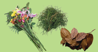
Desechos de jardín