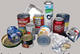
Latas de metal y papel de aluminio.