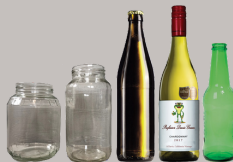
Envases de vidrio para alimentos y bebidas.